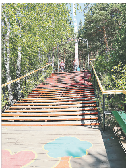
Сосновый парк и часовня у источника стали не только «точкой притяжения» абанцев, но и символом села