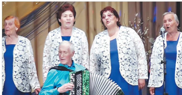
Концерт народного самодеятельного коллектива – хора «Ветеран», посвященный 15-летию юбилею