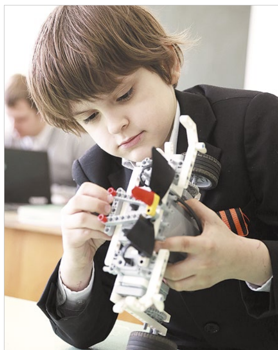
Благодаря президентскому гранту занятия робототехникой в Богучанах бесплатны

От окна школы, что в поселке Геофизиков, я просто не могла отойти. Как будто вместо стекла – пейзаж, написанный талантливым художником. Синяя гладь Ангары. Синее небо. И на их фоне – ветви ангарской сосны. Легко можно забыть обо всем. А я ведь приехала сюда не просто