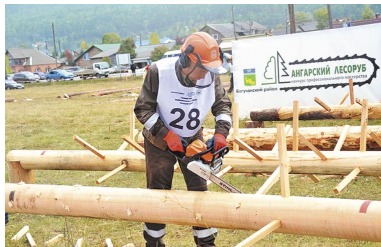
Праздник День лесника отмечают профессиональным конкурсом «Ангарский лесоруб»

понимая при этом, какой ценой была завоевана победа. Из военных находок, фотоматериалов поездки в школах начнут формироваться музейные уголки. Сделаем все, чтобы в следующем году поисковую работу школьники района продолжили.