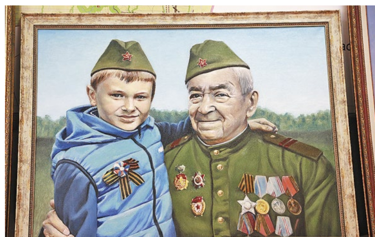
Галерея Победы с портретами участников ВОВ открылась в Богучанах в этом году

Значительную часть портретов написали ученики и педагоги школ искусств района, попутно изучив биографию своих прадедов. Планируем подготовить и издать «Книгу памяти». Информацию о ветеранах Великой Отечественной нашего района собирают и школьники, и учителя, и работники культуры, и просто энтузиасты. Впервые за всю историю существования района наши школьники в этом году в составе поискового движения побывали на раскопках в Волгоградской области. Оборону Сталинграда держали армии, в составе которых сражались сибиряки. Сейчас школьники рассказывают о своих впечатлениях. Впервые за всю историю существования района наши школьники в этом году в составе поискового движения побывали на раскопках в Волгоградской области. Оборону Сталинграда держали армии, в составе которых сражались сибиряки. Сейчас школьники рассказывают о своих впечатлениях. Впервые за всю историю существования района наши школьники в этом году в составе поискового движения побывали на раскопках в Волгоградской области.