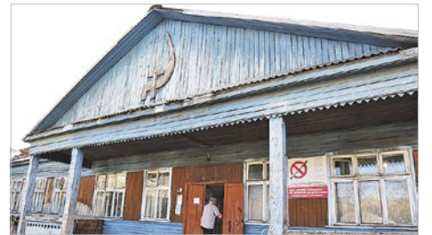
Самый первый корпус больницы в Богучанах появился в конце 1930-х годов

сможет избежать серьезных последствий. Специалист делает снимок. Если ишемический инсульт, значит, можно применить тромболитис. Пациенту вводят лекарство, которое растворяет тромб. Пока такое лечение доступно только в крупных сердечно-сосудистых центрах края.