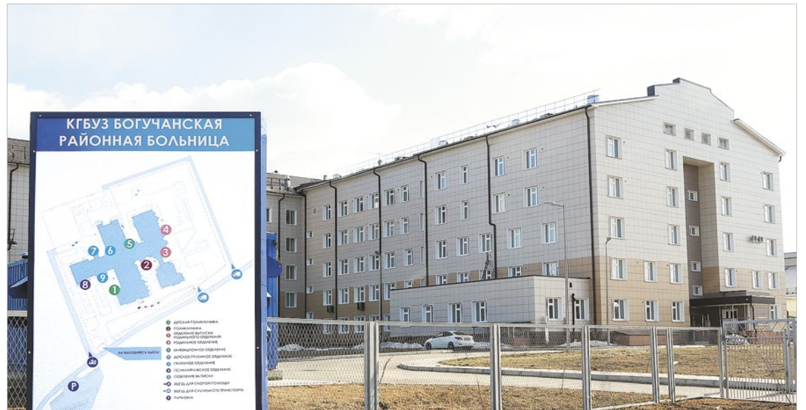
Современная больница для жителей района, которая строилась более 10 лет, должна открыться буквально на днях

Благодаря томографу часть пациентов с инсультом