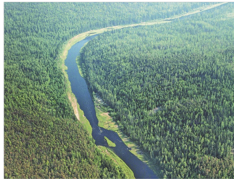
На территории Красноярского края сосредоточено 4 % мирового запаса древесины. Значительная часть находится в Богучанском районе

– Законодательство и в отношении транспортировки ужесточилось: лесовозчик должен также иметь соответствующие документы на транспортировку древесины, где указывается номер декларации по сделке. Он в свободной базе. Сотрудники ГИБДД останавливают машину и сверяют документы. Может, там номер стоит по той лесосеке, где уже закончился срок разрешительных документов или объем заготовки с данного участка меньше, чем объем вывозки... Понимаете, даже уже водитель лесовоза на такое не пойдет: если его поймут, то машину отправят на штрафплощадку. Теряет временно источник дохода – а для него это убыток.