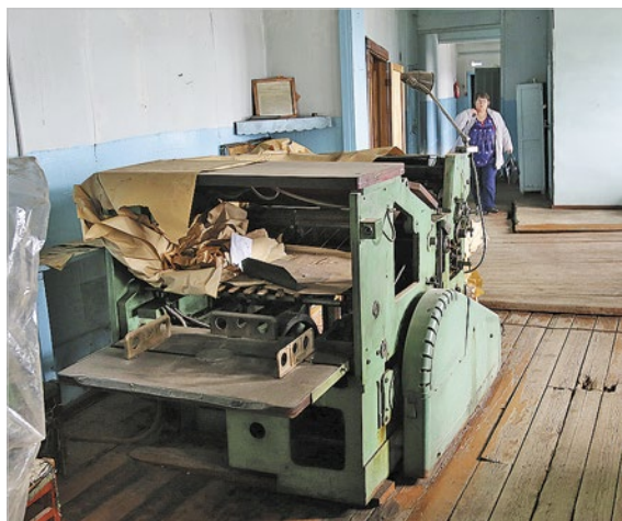
Особая страница истории газеты – местная типография. Она обеспечивала печатной продукцией весь район, машины работали днем и ночью

Первые номера набирались вручную – буква к букве, и когда появился первый литье – строкоотливная машина, – все вздохнули с облегчением, стало возможным отливать из металла целые строки. Рисунки в газете много лет назад появлялись с помощью типографского клише