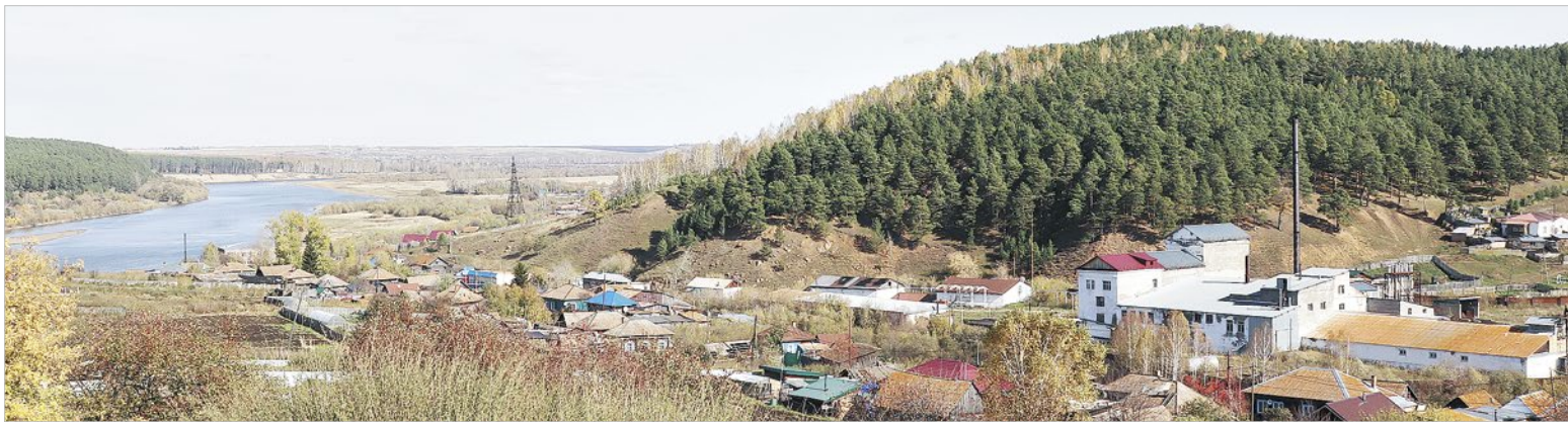
В Красном Заводе знаменитый боготолец, режиссер Виктор Трегубович, снимал свой фильм «Трижды о любви»

Рельсы в Сибири появились только в конце XIX века, а поселения русских людей на территории нынешнего Боготольского района – гораздо раньше. Одно из старинных сел с богатой историей – Красный Завод, которое стоит на обоих берегах Чулыма.