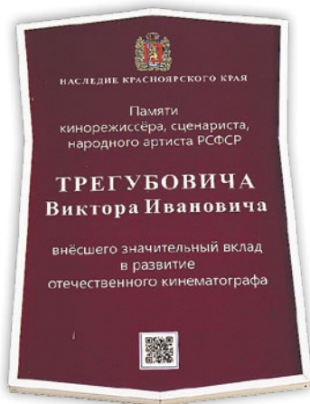
Памятная доска на стене бывшего ДК железнодорожников

Так попала сюда репрессированная актриса и режиссер Елизавета Розенель-Альфредо-