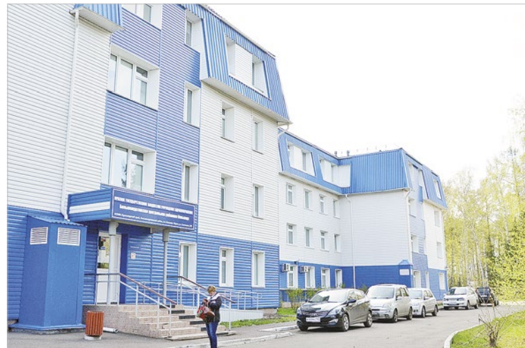
Несколько лет назад у районной больницы был построен новый корпус

Большемуртинская больница действительно очень преобразилась. Восемь лет назад здесь построили четырехэтажный корпус с терапией, хирургией, станцией скорой помощи, установили новое диагностическое оборудование, рентген.