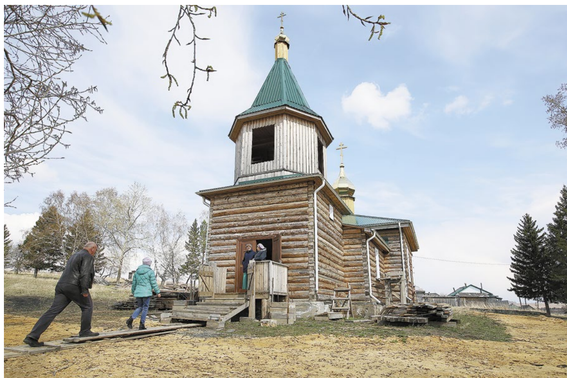
Старинную церковь в селе Новоникольском восстанавливали всем миром