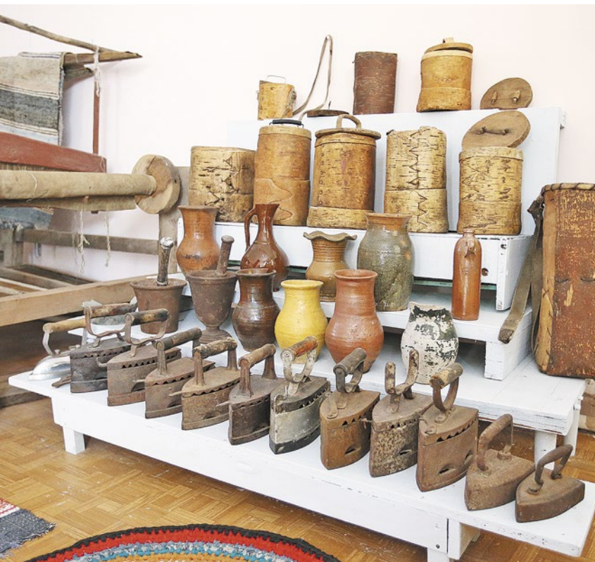
По предметам быта сибирского крестьянства можно изучать историю