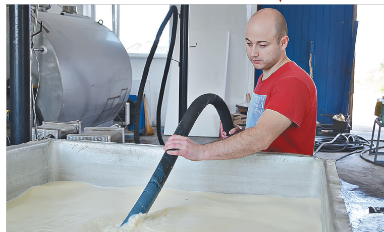
Свежее молоко после обработки в специальных термобочках отвезут на заводы

выплачивают подъемные при устройстве на работу. С помощью другой программы построили уже четыре дома для сотрудников.