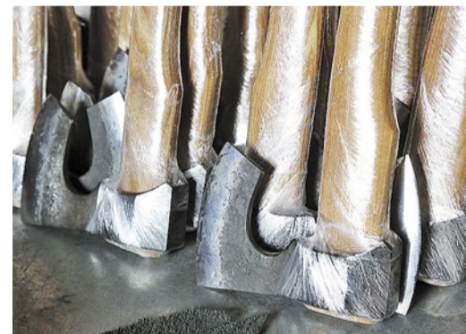
Слава мастера Игоря Звягина перешагнула границы России – где-то треть топоров уходит за рубеж, сейчас делается крупный заказ для финнов

остудить. Во время этого процесса в металле исчезают все внутренние напряжения, возникшие во времяковки. А потом обязательно правильно закалить. Температура металла должна быть от 610 до 640 градусов. И обязательно теплое масло для закаливания.