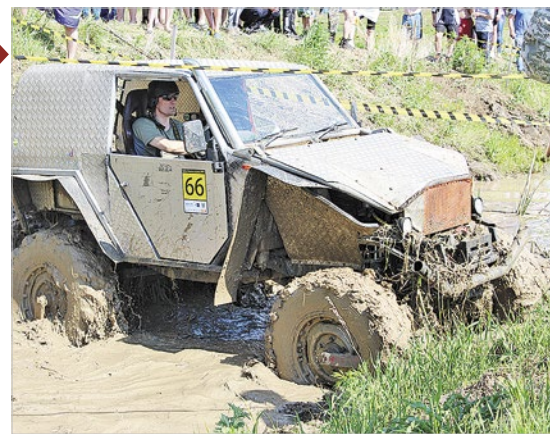
Автор Елена ЛАЛЕТИНА Благодарим за помощь в подготовке материалов главу Казачинского района Юрия Озерских

В последнее время набирают популярность соревнования внедорожников «Мужские игры»