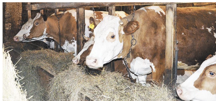
Сейчас в хозяйстве 200 га пашни, коровы, свиньи, овцы, кони. В Матвеевке открыли собственный магазин – мясо и молочные продукты местным жителям продают