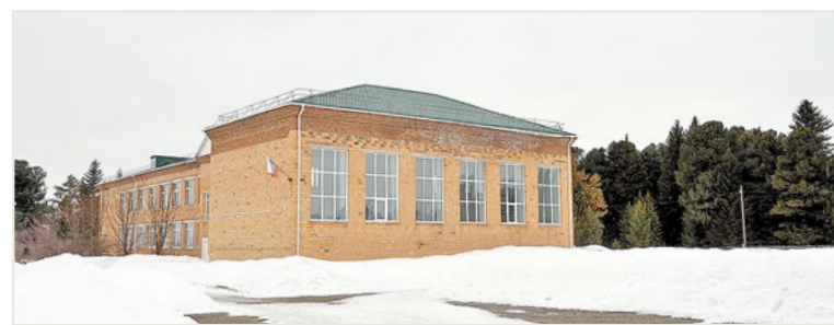
Многовековые кедровники окружают Вороковскую среднюю школу и дарят людям свою целебную силу

Откуда появился кедровник вокруг села Вороковка, сегодня уже никто не помнит. У старожилов свои предположения. Говорят, еще до образования села стоял в этом месте православный монастырь, который основали старообрядцы после раскола церкви. Возможно, местные монахи и посадили вокруг святой обители кедр, которые лучами сходились к центру – монастырю.