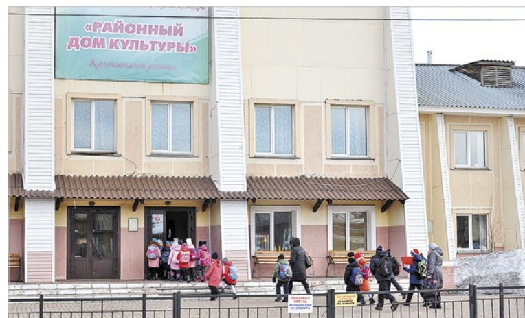
В районном Доме культуры можно и свои таланты проявить, и послушать краевых и российских артистов

центра, оборудуем спортивную площадку в Галанино. Большое внимание уделяем отдаленным сельсоветам. Например, в деревне Казанка сделали дороги и уличное освещение. В прошлом году заменили в местном