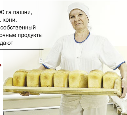
Есть и пекарня. Матвеевский хлеб по всему району развозят. Пользуется спросом: вкусный, без добавок