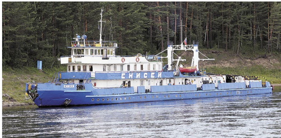
На Казачинском пороге действует уникальный теплоход-туер «Енисей» – единственный в России

А остров Островки, расположенный в районе порогов, хранит тайны пребывания древних людей. Наскальные рисунки, обнаруженные на береговых валунах Енисея, датируются эпохой раннего железного века – Средневековья (I тыс. до н. э. – I тыс. н. э.).