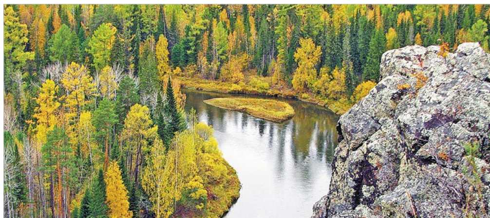
Природа в Кодаинском районе суровая, но красивая

рассказам старожилов, в глухой тайге в окрестностях Дешембинского озера есть некая поляна круглой формы, на которой не растут деревья и в которой творятся странные вещи – животные и птицы, попав внутрь этого круга, падают замертво, а мясо их становится вареным и приобретает красный цвет.