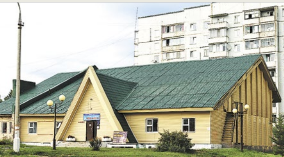
Бывший спортзал, приспособленный под Дом культуры

Еще одна кодинская боль – физкультурно-спортивный комплекс. Которого тоже нет. Хотя под него давно уже и место выделено, еще при прежних губернаторах. Но там пустырь. А жителям современного города очень хочется иметь современное спортивное сооружение, люди стремятся жить цивилизованно, хотят заниматься физкультурой и спортом. В этом году кодинцы даже устроили флешмоб – вышли на площадь и выстроились в слова: «Нам нужен ФСК с бассейном!» Сфотографировали этот «человеческий плакат» с дрона, выложили в соцсети. В надежде, что власть их услышит.