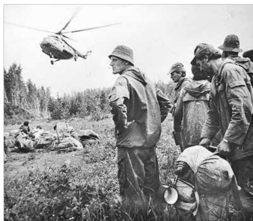
1988 год. Экспедиция к Чертовой поляне