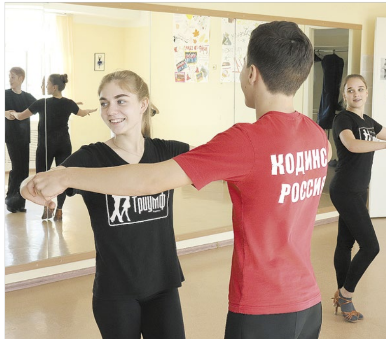
На репетиции образцового художественного коллектива бального танца «Триумф»

– Но это еще и тяжелый труд: чтобы чего-то добиться, нужно очень много работать, –