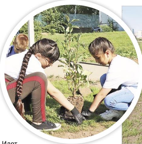
Идет благоустройство: дети сажают кусты сирени