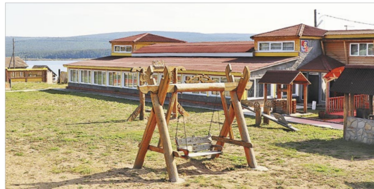
Спортивно-туристическая база «Альянс»

Руководство района собирается развивать на базе «Альянса» и гостинично-туристический бизнес, места хватит всем. Природа вокруг замечательная, пейзажи красивые, база стоит на берегу Ангары в месте впадения в нее речки Чадобец. Тайга рядом. Для рыбаков и охотников – рай. Да и для семейного отдыха тоже. Только нужно, конечно, оборудовать хороший ресторан с блюдами сибирской кухни (туристов привлекает кулинарная экзотика), нужны пляж, прокат лодок, профессиональные гиды, экскурсионные программы.