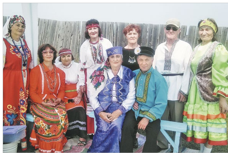
Участники самодеятельности из села Заледеево

Больше всего сельские культработники гордятся тем, что второй год организуют в Заледееве фестиваль народного творчества «Ангарские мастера – краю». Люди участвуют в нем с удовольствием: здесь устраиваются соревнования по рыбалке, проводятся мастер-классы: ткачество, плетение сетей, резьба по дереву. Дети играют в старинные народные игры.