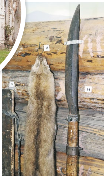
Этот большой нож на древке называется пальма – грозное оружие, с которым ангарские охотники ходили на медведя. Подлинный экспонат, ему не меньше ста лет

Уникальные изделия кежмарей хранятся в музее – под-