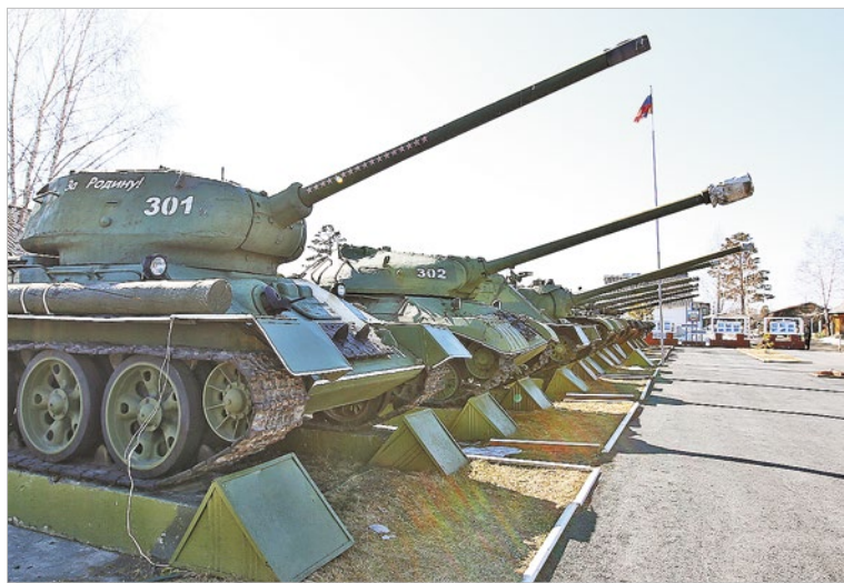
В музее войсковой части весь «модельный ряд» танков – нет только новой «Арматы»

– В районе успешно реализуются целевые муниципальные программы, направленные на социальную поддержку населения, развитие образования, культуры и спорта.