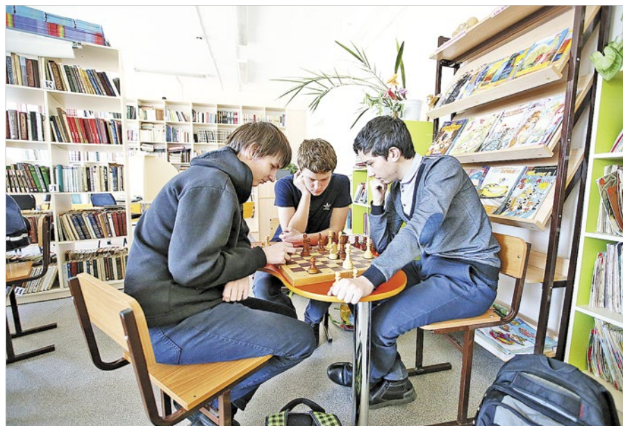
Ребята принимали участие в обустройстве библиотеки