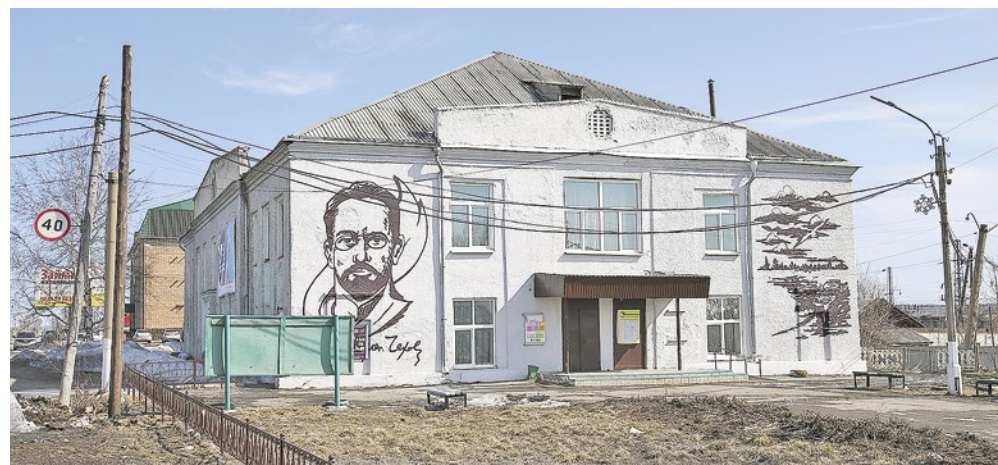
Антон Чехов, путешествуя по Сибири, очень боялся «таинственной Козульки»...

Классик русской литературы Антон Павлович Чехов также не застал паровозной тяги – он проезжал здесь в собственном экипаже и даже записал в дневниках, что страшится «таинственной Козульки». Бояться действительно было чего – риск застрять, сломаться или опрокинуться был велик на всем протяжении пути, о чем ему рассказывали все, кто встречался ему по дороге. В итоге, как признавался писатель, село начало ему сниться в виде птицы с длинным клювом и зелеными глазами. Самым страшным местом в то время назывался промежуток в 22 версты между Черноярской и Козульской – станциями, на которых меняли коней. «За две, за три станции до страшного места начинают уж показываться предвестники. Один встречный говорит, что он четыре раза опрокинулся, другой жалуется, что у него ось сломалась, третий угрюмо молчит...» – записал Чехов в дневниках. Сегодня здесь пролегает одна из лучших автодорог во всем крае.