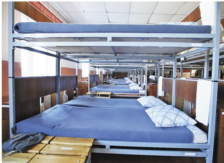
В казармах всегда строгий армейский порядок

Первоначально часть создавалась в Таскино в 1978 году. Однако в августе 1985 года была передислоцирована в Козулку. Здесь в тайге построили казармы и необходимые объекты инфраструктуры.