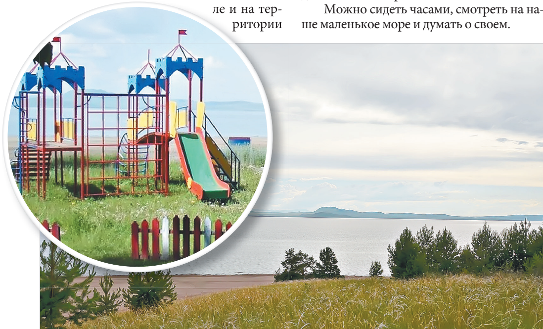
Тот, кто хоть раз побывал на пляжах Краснотуранского района, непременно захочет приехать сюда снова

Можно сидеть часами, смотреть на наше маленькое море и думать о своем.