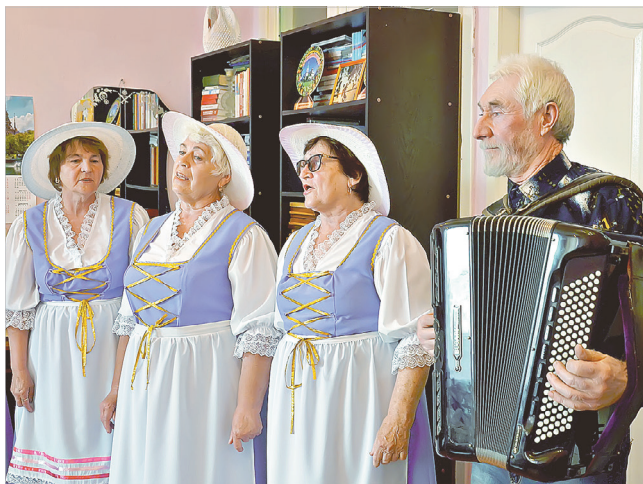
В переводе с немецкого название ансамбля «Моргетай» звучит как «Утренняя роса»