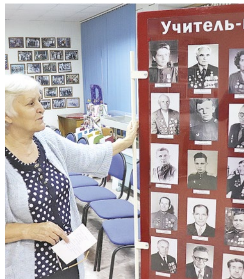
В школьном музее бережно собрана история района

Еще в конце 70-х годов, до появления музея, в школе была создана первая поисковая группа из старшеклассников, которые собирали информацию об истории района, его сел и деревень. Школьники